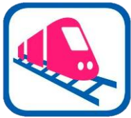
Tabla de contenido -Plan de Gobierno Municipal