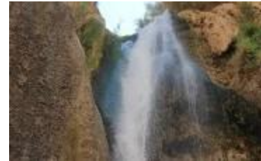
Catarata de Canahura