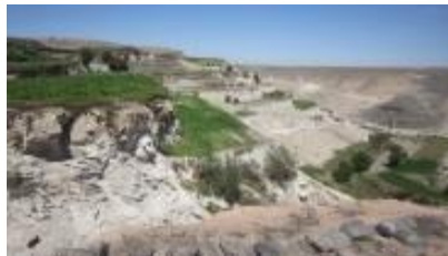
Quebrada de Añashuayco