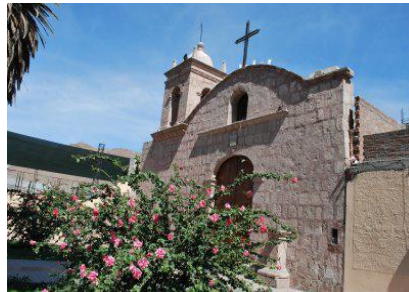
Iglesia San Pedro

Conoce un poco más las maravillas de Uchumayo