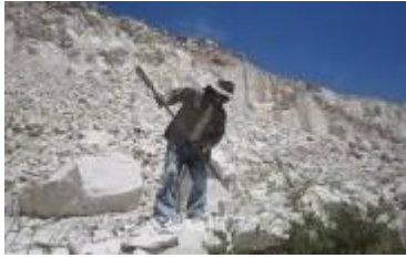
Cantera del Sillar