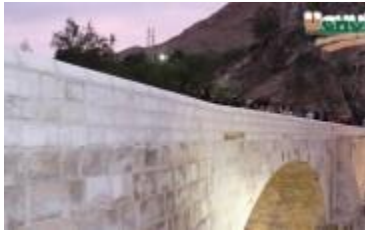
Puente San Pedro