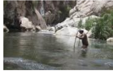
Valle de Canahura