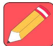
Tabla de contenido