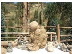
La Momia de Kankán. Ubicado en el Caserío El Rosal, distrito de Julcán a tan sólo 40 minutos caminando.

Entre los aspectos llamativos del sitio arqueológico encontramos la edificación en la cima norte, la cual solo tiene una sola entrada de acceso a la planicie, la misma que permitía ingresar a este conjunto de edificaciones arquitectónicas, que por sus cumbreras aún presentes fueron cubiertas con techos a dos aguas. Todo la cima fue encerrada con un muro perimetral a base de piedra canteada y argamasa de barro, contando con un solo ingreso el cual restringe su acceso a una modalidad de fortificación, en su interior presenta una armazón aglutinada de estructuras rectangulares y cuadrangulares, existiendo presencia en sus muros de puertas, ventanas y hornacinas, todos estos ambientes estaban asociados con amplios espacios abiertos conducidos por angostos pasadizos.