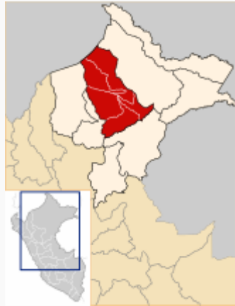
Ubicación de Loreto