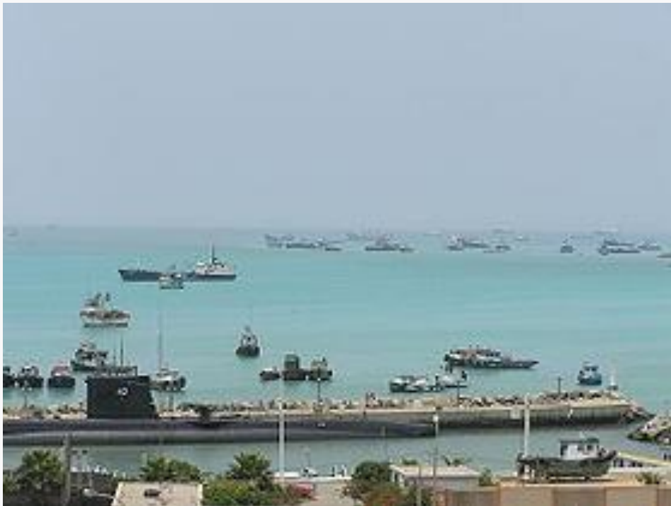
Vista del puerto, con el submarino BAP Abtao en primer plano.