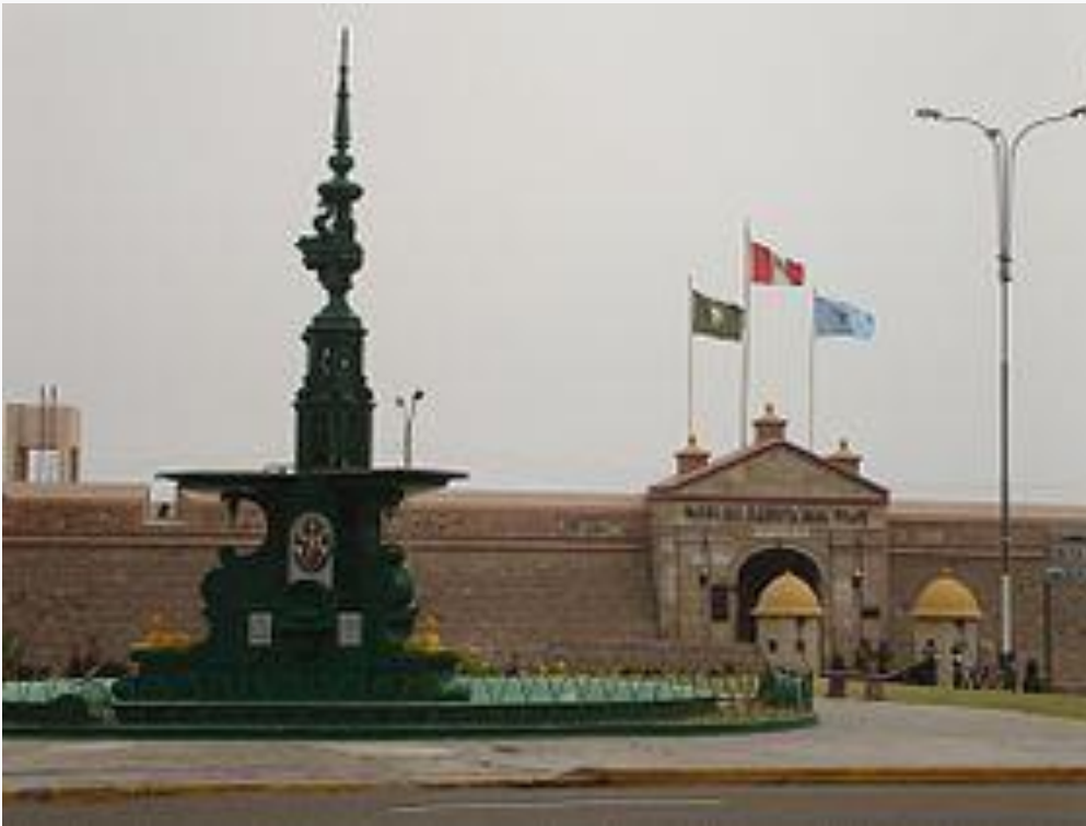
Fortaleza de Real Felipe.