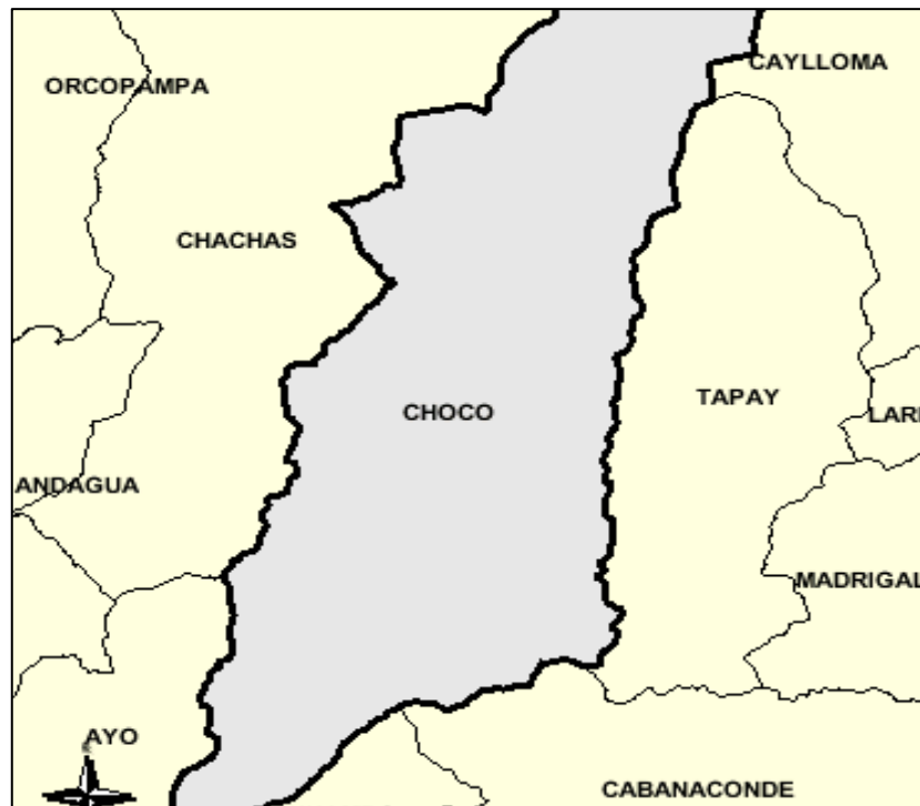
Mapa 01: Ubicación geográfica del distrito de Choco