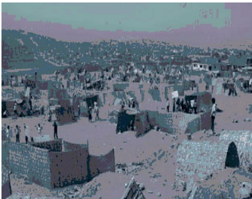
Invasión en el sector conocido como Ciudad de Dios, el génesis de nuestro distrito.

Dentro de la última década, también se ha presentado como dueña de una parte de nuestro distrito a la Fundación Canevaro, realizado demandas por la Titularidad de la propiedad, pero sin mayores éxitos; y si a ello sumamos los problemas de límites que tenemos con los distritos vecinos, se podrá apreciar mejor lo poco que hemos avanzado