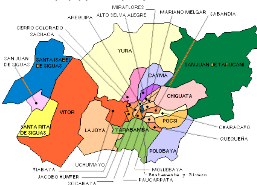
IMAGEN N° 01 UBICACIÓN DEL DISTRITO DE YARABAMBA