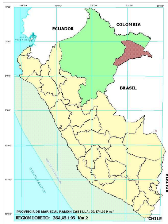
MAPA POLITICO DE LA PROVINCIA MARISCAL RAMON CASTILLA (Desagregado a nivel Distrital)