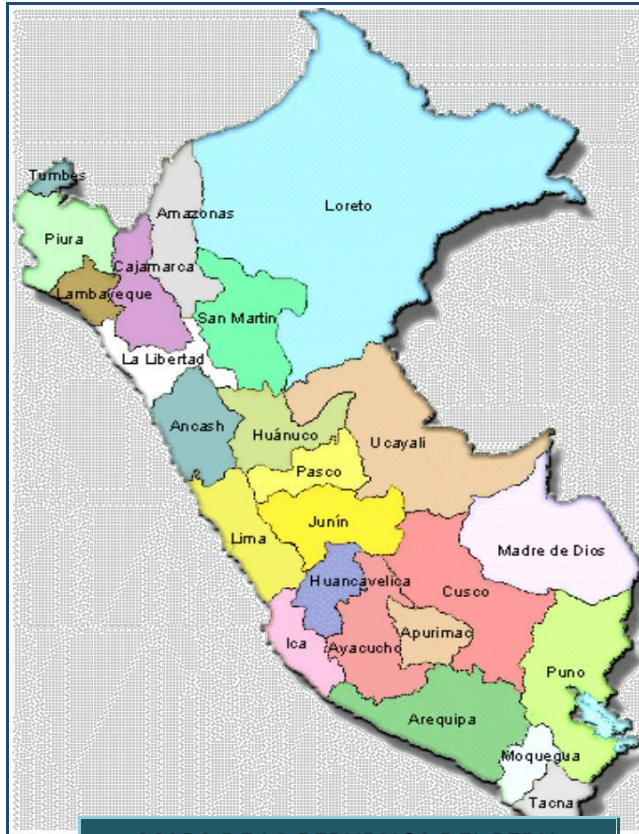
MAPA DE LA REPUBLICA DEL PERU