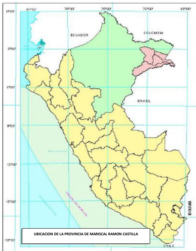
FIGURA N° 01: UBICACIÓN DE LA PROVINCIA MARISCAL RAMÓN CASTILLA

Actualmente cuenta con una población aproximada de 75,664 habitantes. (CEPLAN, Marzo 2018), que representa el 7 % de la población regional con una densidad de 2 habitantes por kilómetro cuadrado. Políticamente, la provincia está conformada por 04 distritos: Ramón Castilla, con Caballo Cocha como capital provincial, Pebas, San Pablo y Yavarí.