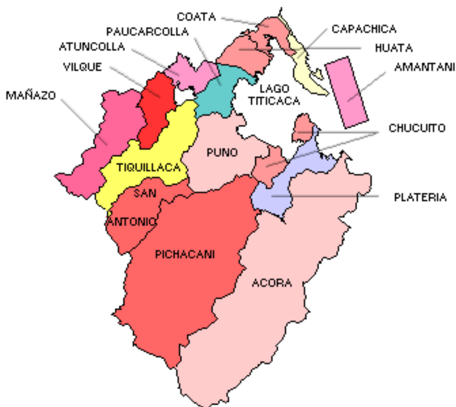
Imagen N° 02 División Administrativa de la Provincia de Puno