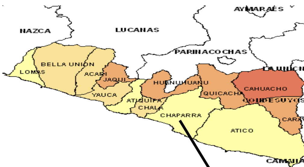
Gráfico N° 01

Cháparra, se ubica en la provincia de Caravelí, región Arequipa, en el sur del Perú. Tiene una superficie territorial de 1473,19 Km, que se extienden desde la costa hasta la cabecera de los Andes, con altitudes que van desde el nivel del mar hasta los 1 400 m.s.n.m, aproximadamente. Su capital es el pueblo de Achanizo, ubicado a orillas del río Cháparra y a una altura aproximada de 600 m.s.n.m.