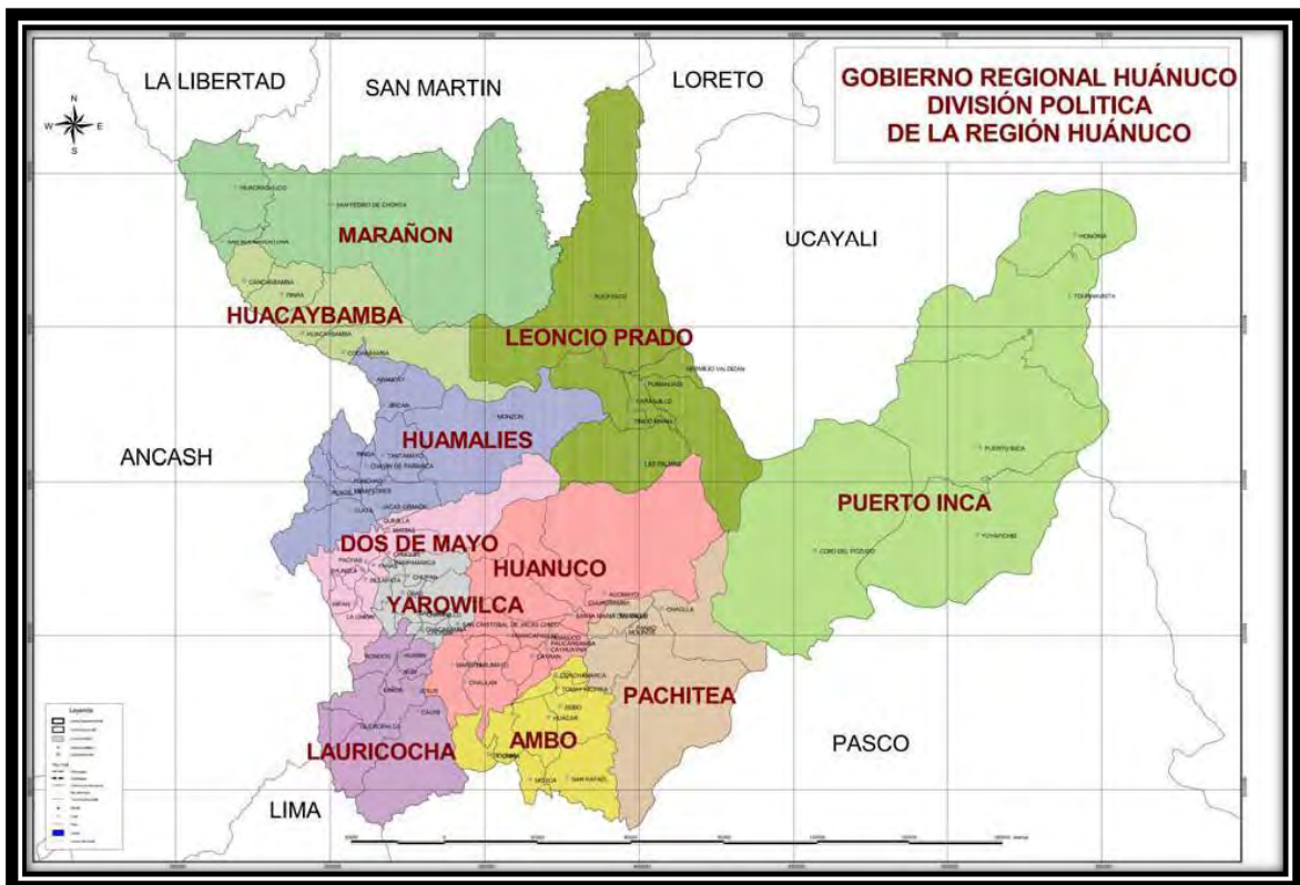
Figura 1: Ubicación Geográfica de la Provincia de Leoncio Prado

Ley de creación Ley N° 11843 del 27 de Mayo de 1952, con su capital Tingo María.