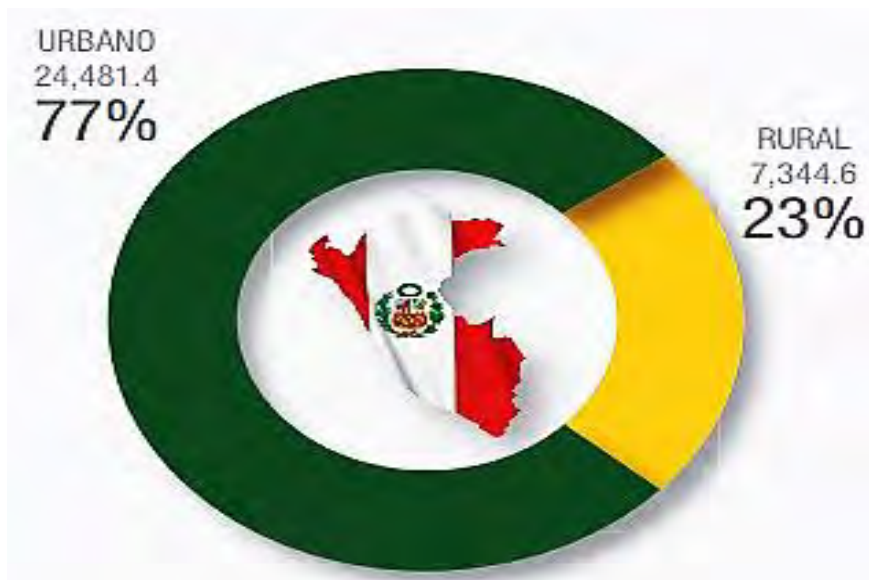
Gráfico 1: La población urbana y rural en el Perú

La población urbana y rural en el Perú en el año 2017 aproximadamente es de 77% urbano y un 23% rural como observamos en la siguiente imagen.