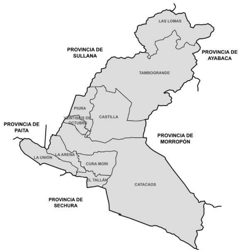
MAPA DE LA PROVINCIA DE PIURA

Tiene una extensión territorial de 35,892.49 Km 2 , se localiza en la latitud 4° 4' 50", su longitud oeste entre los meridianos es 80° 29' 30" y 81° 19' 36", el sector con menor altitud es Bayóvar con 37 metros por debajo del nivel del mar (Depresión) y el sector con mayor altitud es Ayabaca con 2,709 metros sobre el nivel del mar (m.s.n.m). Comprende además el Desierto de Sechura, el más extenso del Perú.