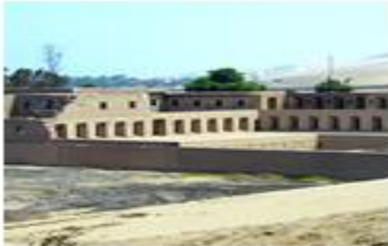
Santuario de Pachacamac