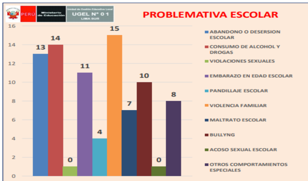
Figura N° 01

En el distrito de Lurín se requiere la reducción del número de niñas, niños y adolescentes víctimas de violencia familiar y escolar, Según CODISEC del año 2018 se registraron 15 de casos de violencia familiar, 14 casos de consumo de alcohol y drogas 13 casos de abandono o deserción escolar, como tercer problema, 11 casos de embarazo en edad escolar, los casos de bullying, los casos de pandillaje que se presentaron fueron 4 casos y los casos de acoso sexual escolar presento 1 caso. Figura 01.