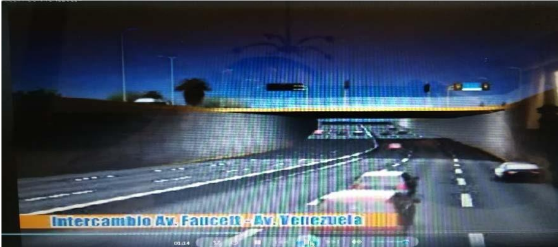
Intercambio vial de Elmer Faucett con Venezuela