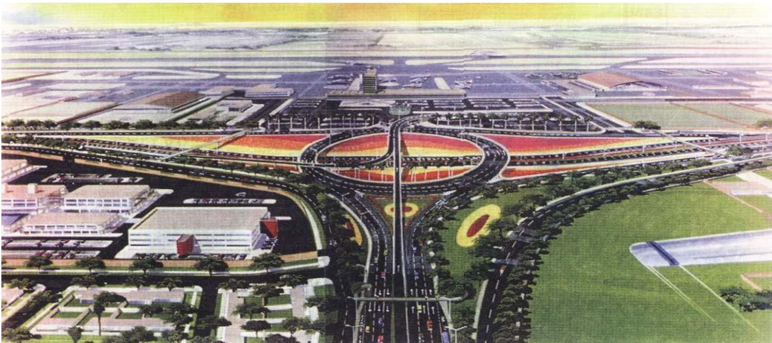
Intercambio Vial avenidas Elmer Faucett con Tomas Valle (Red Vial Nacional)