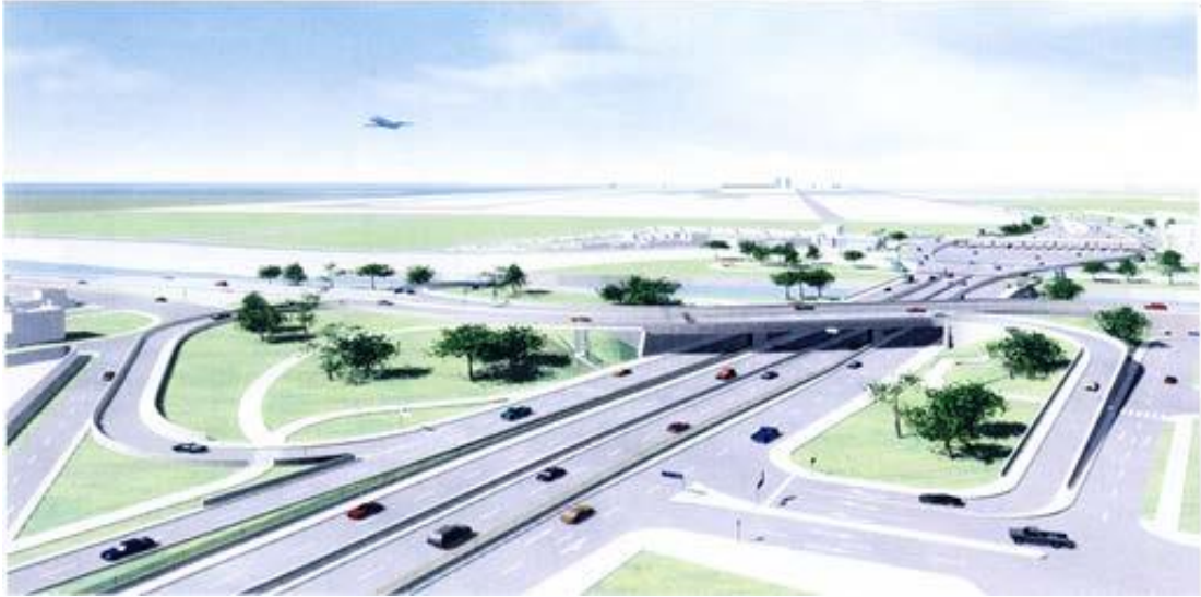
Intercambio Vial avenidas Elmer Faucett con Morales Duarez