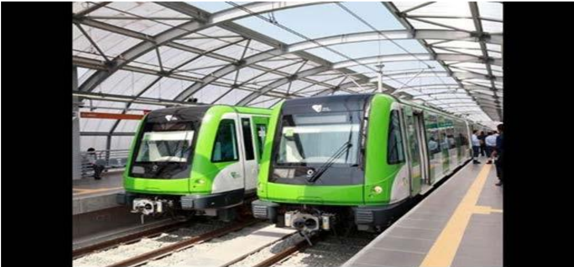
TREN ELECTRICO DE LIMA – CALLAO