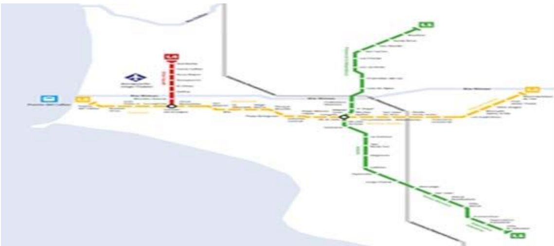
RUTA LINEA 2 Y LINEA 4 DEL TREN ELECTRICO DE LIMA - CALLAO