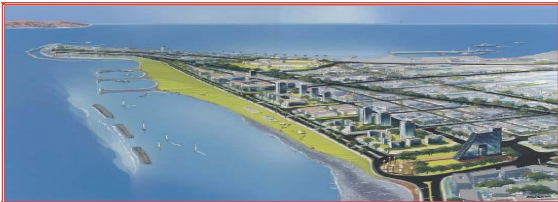
Proteccion Ribereña en la Zona Sur