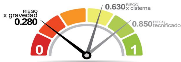
Cuadro No. 18: Eficiencia de uso de agua - proyectado