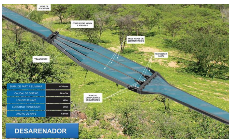
Gráfico No. 4: Infraestructura de riego por gravedad

Canalización de 500 mts, de canal principal cuyo expediente técnico está vigente y a la fecha no ha sido ejecutado en gestiones anteriores. Así mismo, se requiere promover la ejecución de otras obras de mejoramiento de infraestructura de riego en convenio con la Comisión de Usuarios de Surco.