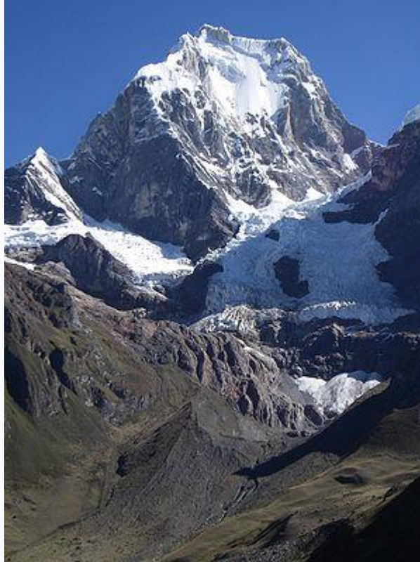
El Yerupajá , una de las cumbres más elevadas del Perú.

Tiene atractivos típicos de la sierra y de la selva, además su ciudad capital se encuentra en un acogedor valle interandino. En Huánuco , destaca su Plaza de Armas, la catedral y las iglesias de San Francisco, Cristo Rey y San Sebastián, que conserva la única escultura del mundo donde este mártir aparece con manchas de viruela en el cuerpo.