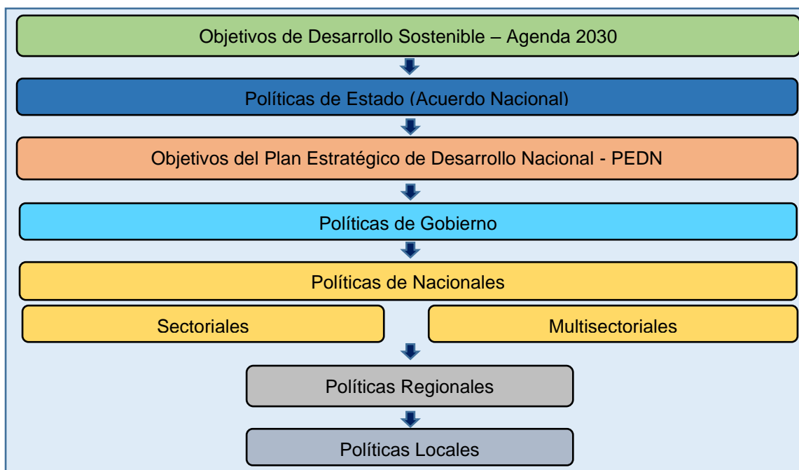
Figura 2. Articulación de políticas y planes