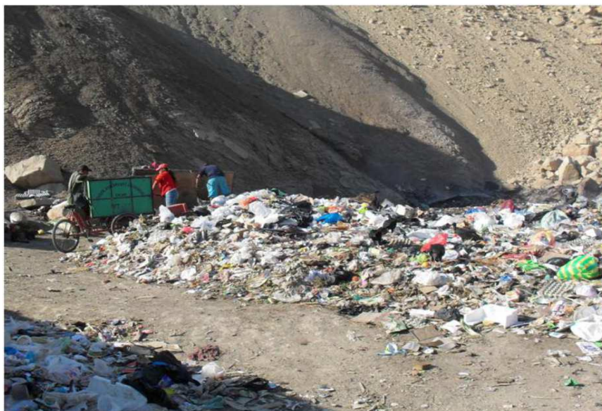
Figura 5 Botadero en Mercado Modelo