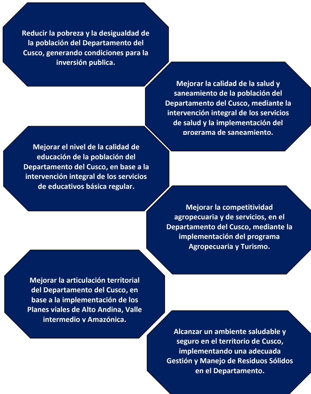
Grafica 2. Lineamientos de política del Gobierno Regional Cusco