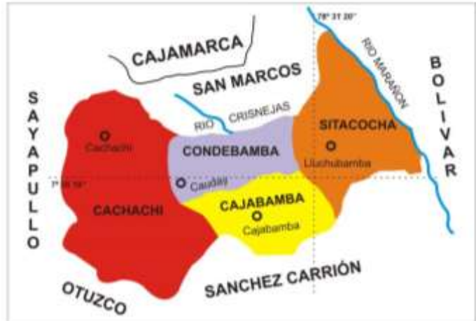
CUADRO N° 01: SUPERFICIE TERRITORIAL Y POBLACION ESTIMADA POR DISTRITO AL 2018