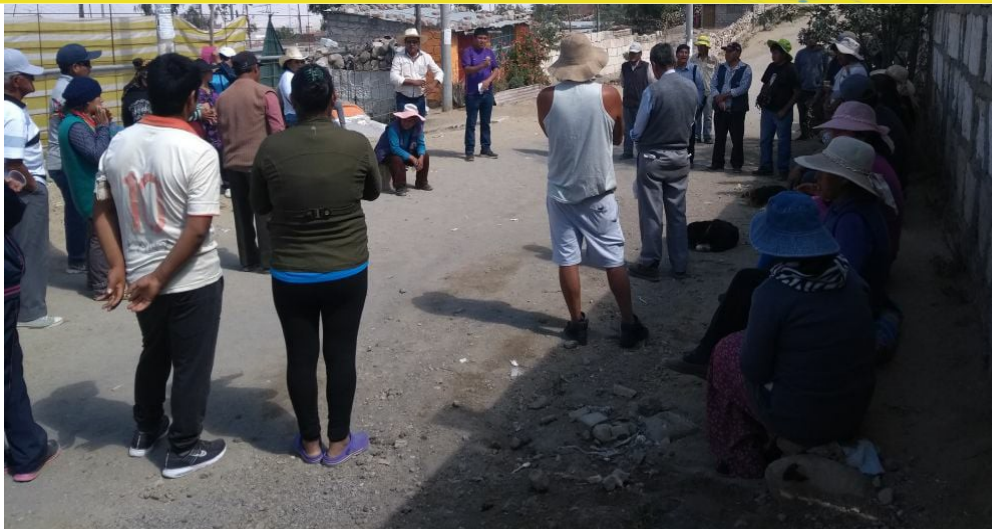
Ilustración: Reunión con actores temáticos para validar las propuestas del Plan de Gobierno 2019-2022.