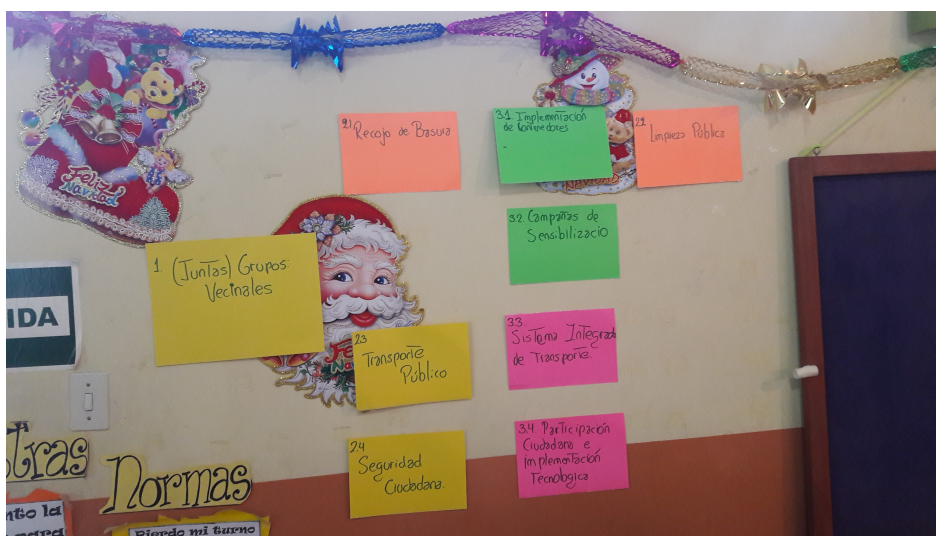
Ilustración: Taller para elaborar las propuestas del Plan de Gobierno 2019-2022.