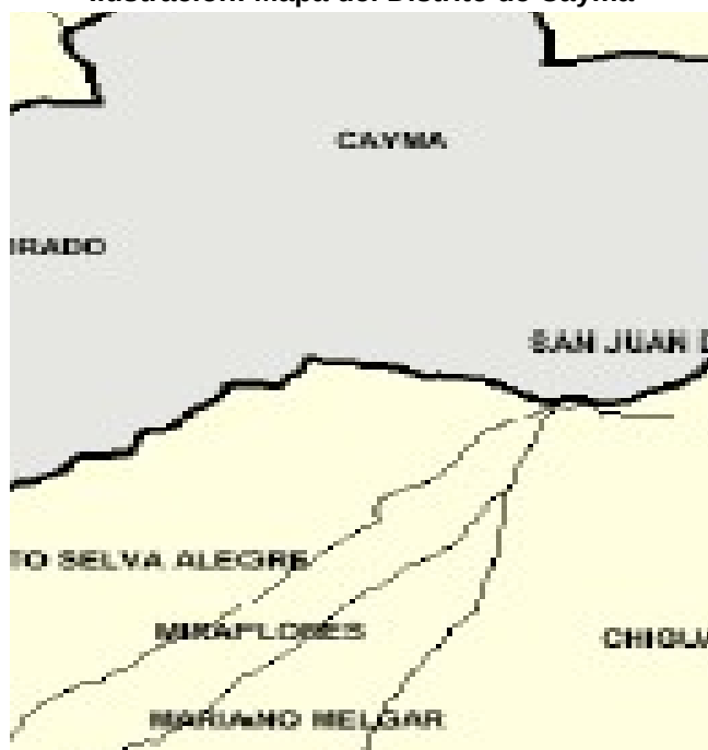
Ilustración: Mapa del Distrito de Cayma