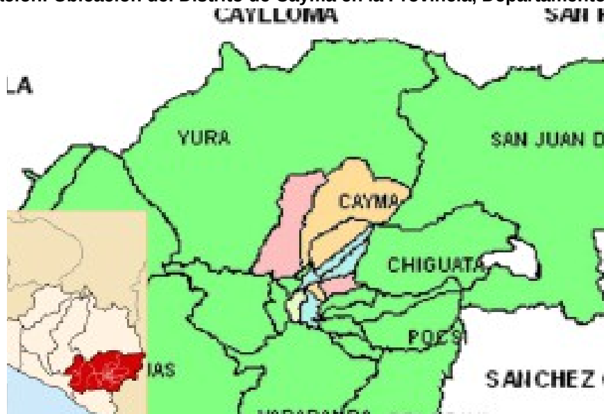
Ilustración: Ubicación del Distrito de Cayma en la Provincia, Departamento y País