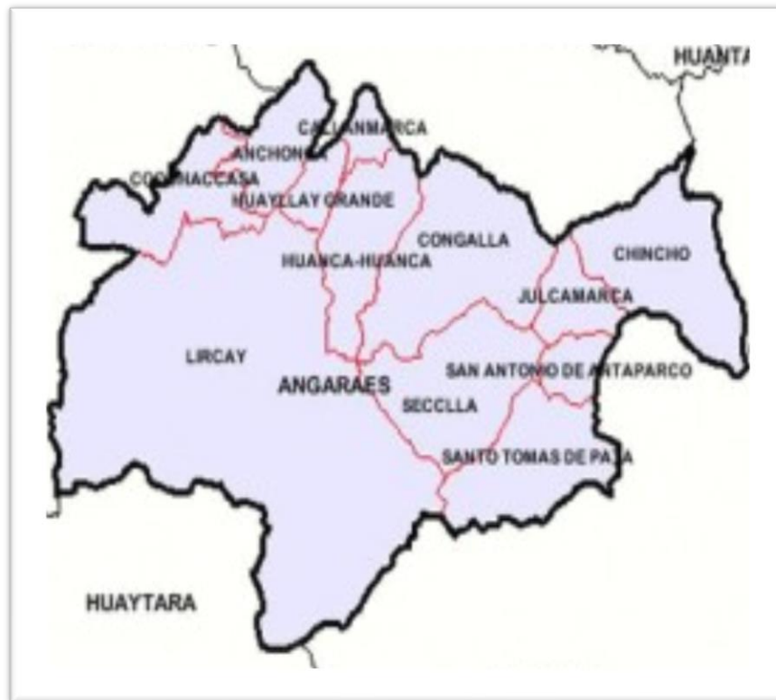
MAPA 2: Distritos de la provincia de Angaraes

b) Historia: La provincia de Angaraes se crea mediante Decreto Supremo del 21 de junio de 1825 dado por el Libertador Simón Bolívar, formando parte del departamento de Ayacucho. En 1826, el general Andrés de Santa Cruz, incorpora Angaraes a la intendencia de Huancavelica como distrito, y el año 1847 se restablece la categoría de provincia por Decreto Supremo del Presidente Ramón Castilla, conformada por los distritos de Julcamarca, Lircay y Acobamba; teniendo como capital al pueblo de Acobamba. En el gobierno de Mariano Ignacio Prado , el 8 de noviembre de 1879, se reconstituye la provincia de Angaraes, con Lircay como su capital.