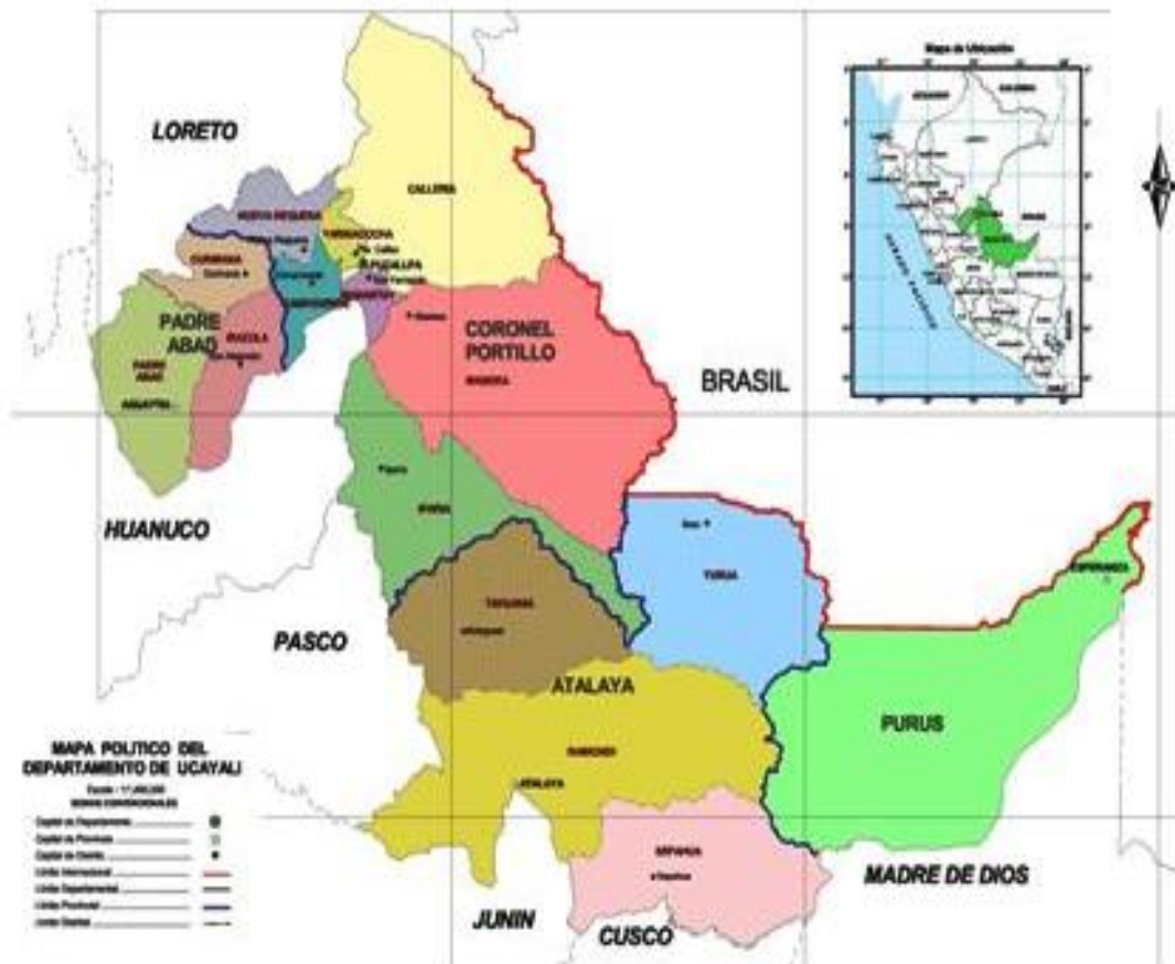
Mapa Político del Departamento de Ucayali.