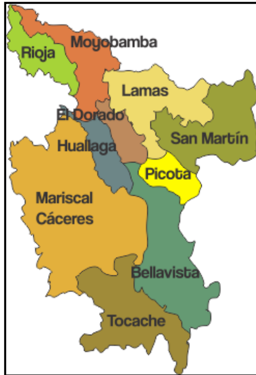
Grafico N° 02: Mapa de la Provincia de Mariscal Cáceres