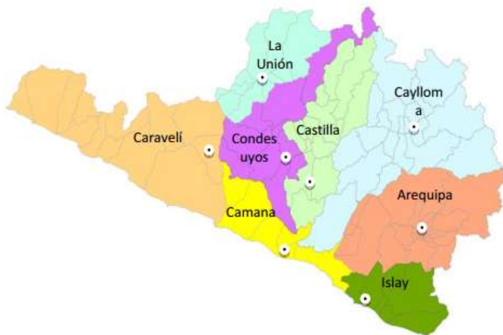
Imagen N° 01 La Región Arequipa