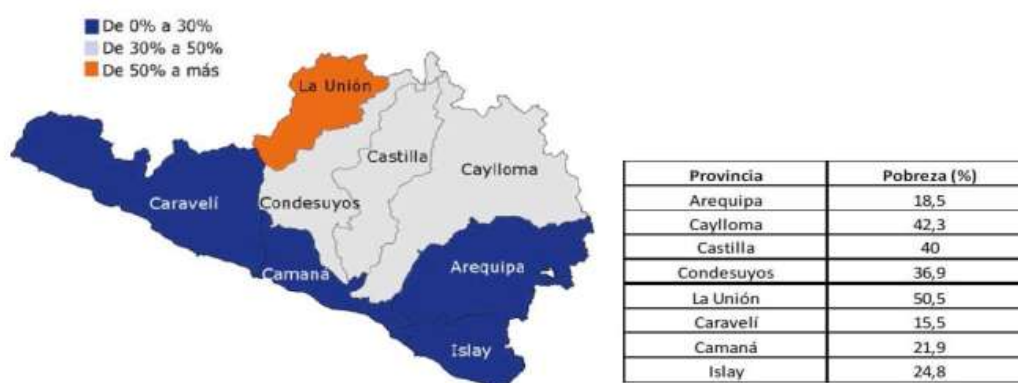
Imagen N° 04 POBREZA EN LAS PROVINCIAS DE AREQUIPA, 2014