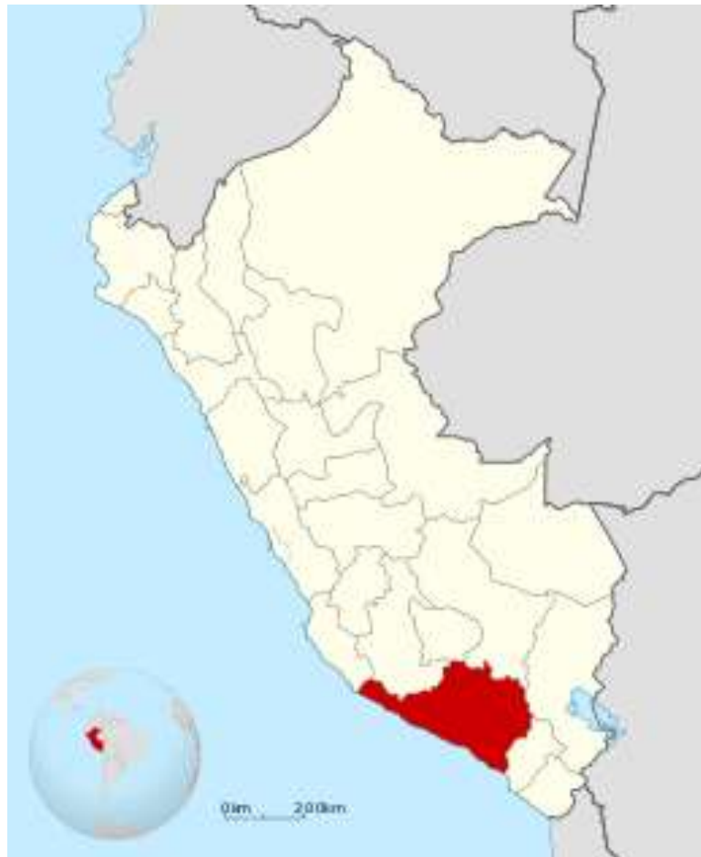
Imagen N° 2 UBICACIÓN DE LA REGIÓN AREQUIPA EN EL PERÚ