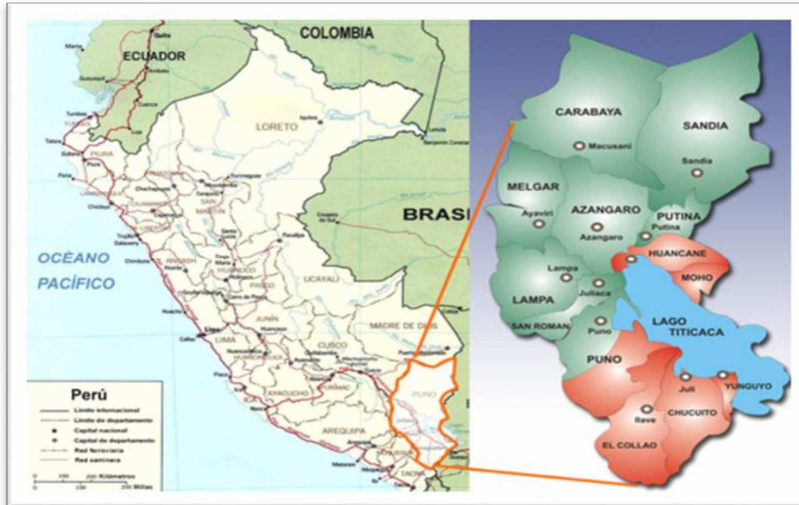
Grafico N° 1: Mapa de la Provincia de Yunguyo