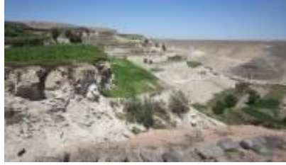
Quebrada de añashuayco