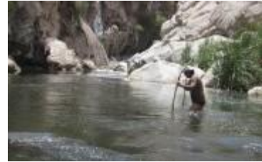
Valle de Canahura