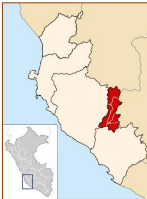
Mapa Región Ica