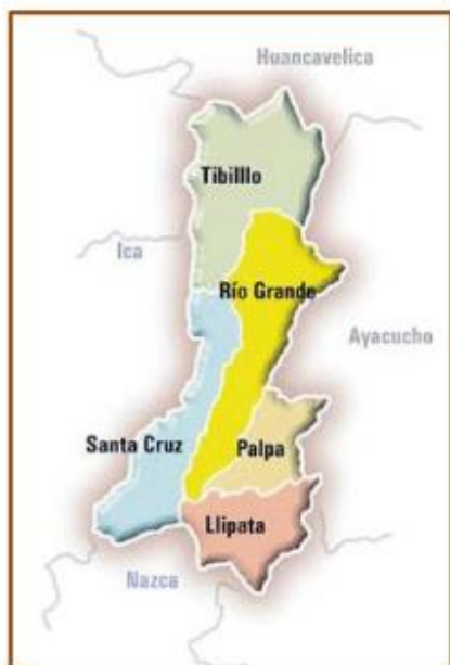
Mapa Provincia de Palpa