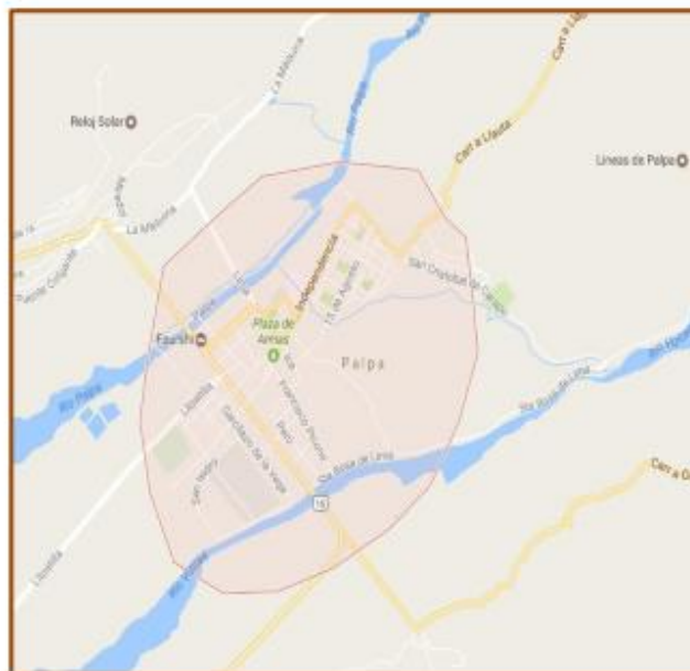
Ruta principal de Palpa