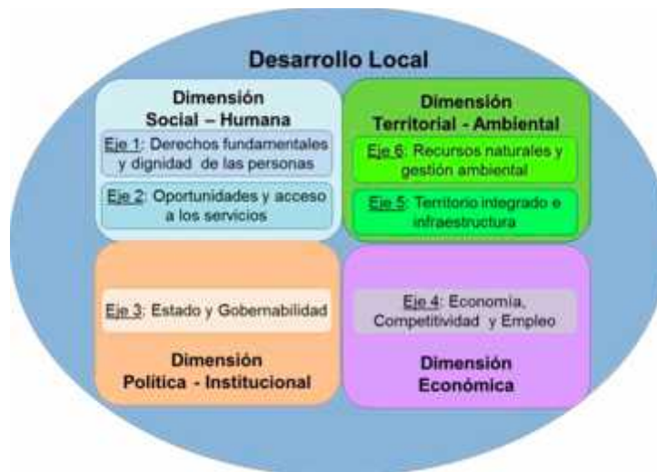
Ilustración: Desarrollo Local, dimensiones y ejes estratégicos