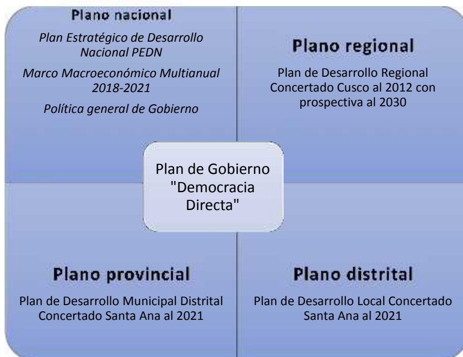
Gráfico 01: Los planos incidentes en el plan de gobierno