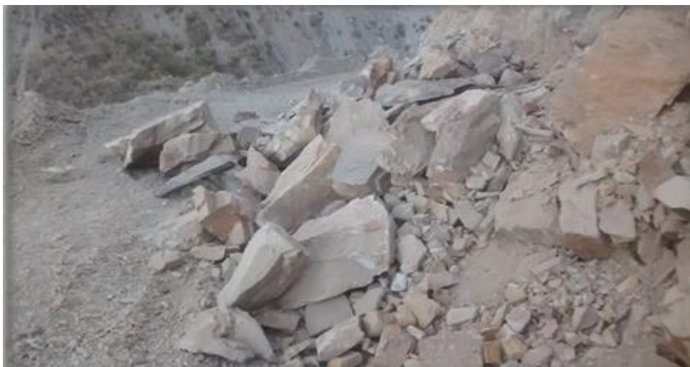
Derrumbe en la carretera al distrito de Uñon

Análisis de Riesgos de los distritos de Castilla Media