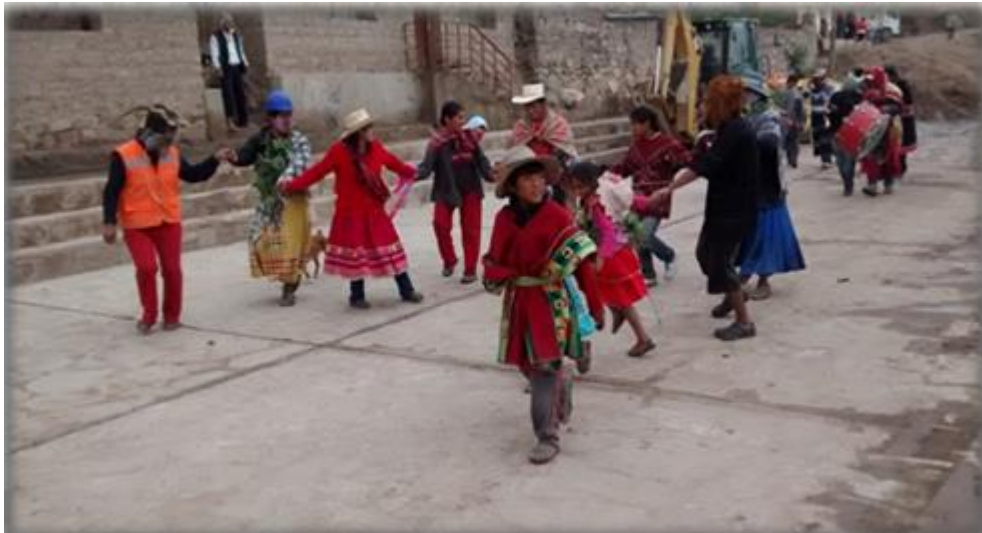
Carnavales 2015 - Uñon

Uñon, además de los recursos presentados, tiene un potencial muy importante para promover el turismo aventura: el clima, paisaje, costumbres; muchos turistas buscan este tipo de escenarios, lamentablemente poco difundidos.