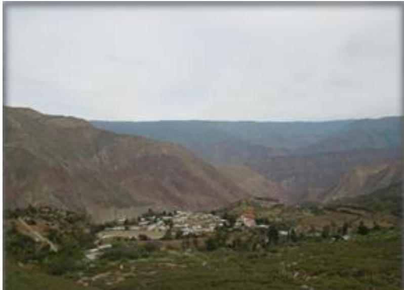
Uñón, capital del distrito