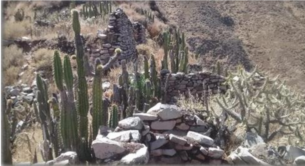
Viviendas Pre inca - Curaspuquio