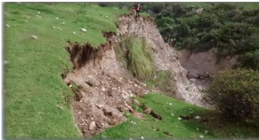
Zona de deslizamientos, anexo Piraucho