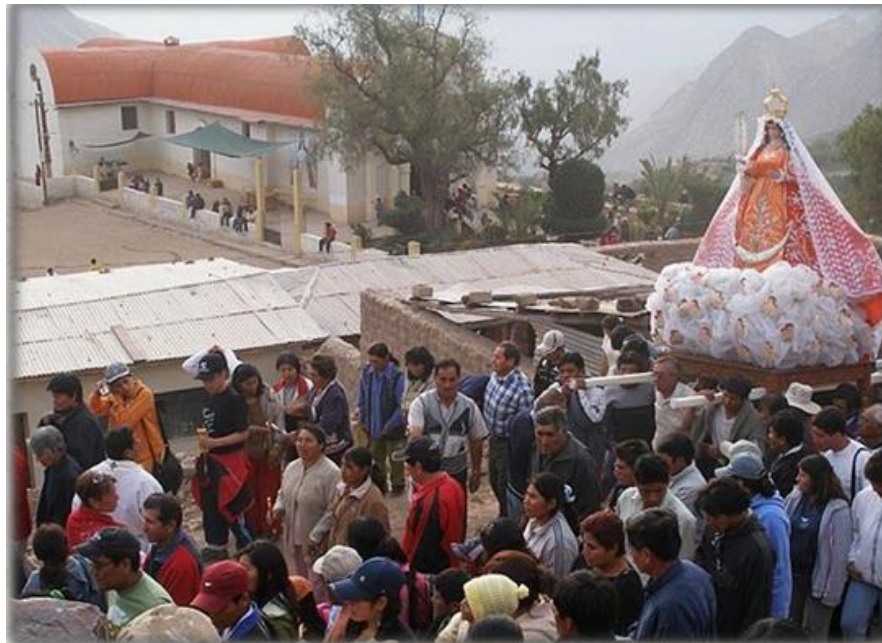
Procesión de la Virgen del Rosario