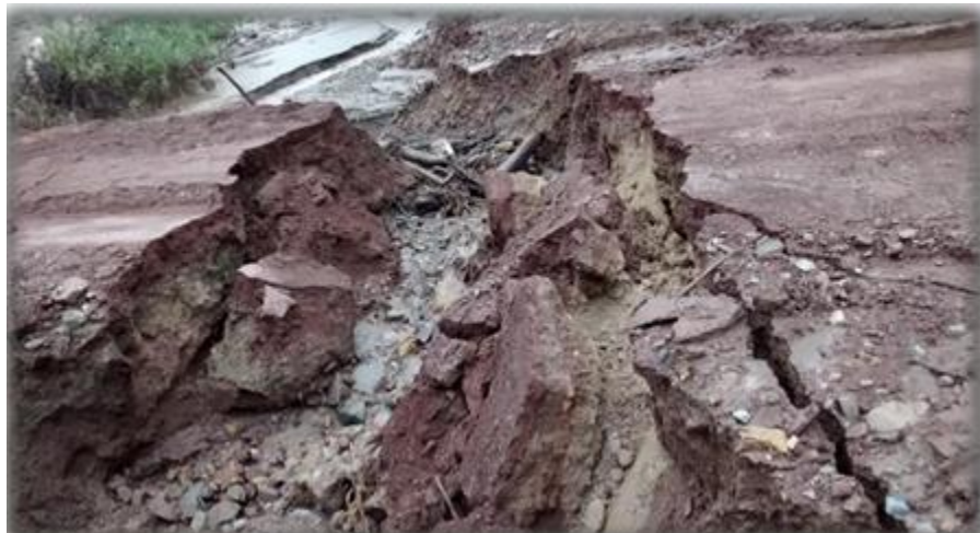
Carretera a Uñon, dañada por Huayco

El Análisis de Riesgo (AdR)* es un diagnóstico del distrito, que identifica dónde y en qué medida las personas y las actividades económicas están expuestas a amenazas naturales (inundaciones, huaycos, Sequías, heladas, deslizamientos, derrumbes, sismos, u otros) y como estas pueden ser afectadas y dañadas por estas amenazas; como evitar y reducir los daños. De esta manera el análisis de riesgos orienta las inversiones del municipio para reducir riesgos en la infraestructura, población y sus recursos económicos.