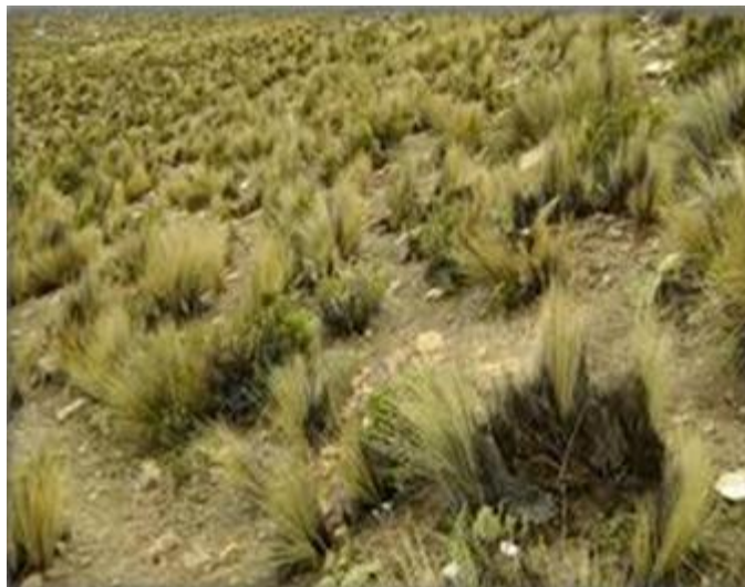
Pastos naturales, zona alta de Piraucho