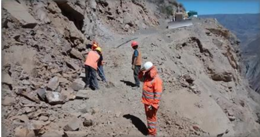
Derrumbe, carretera tramo Capiza - Uñon