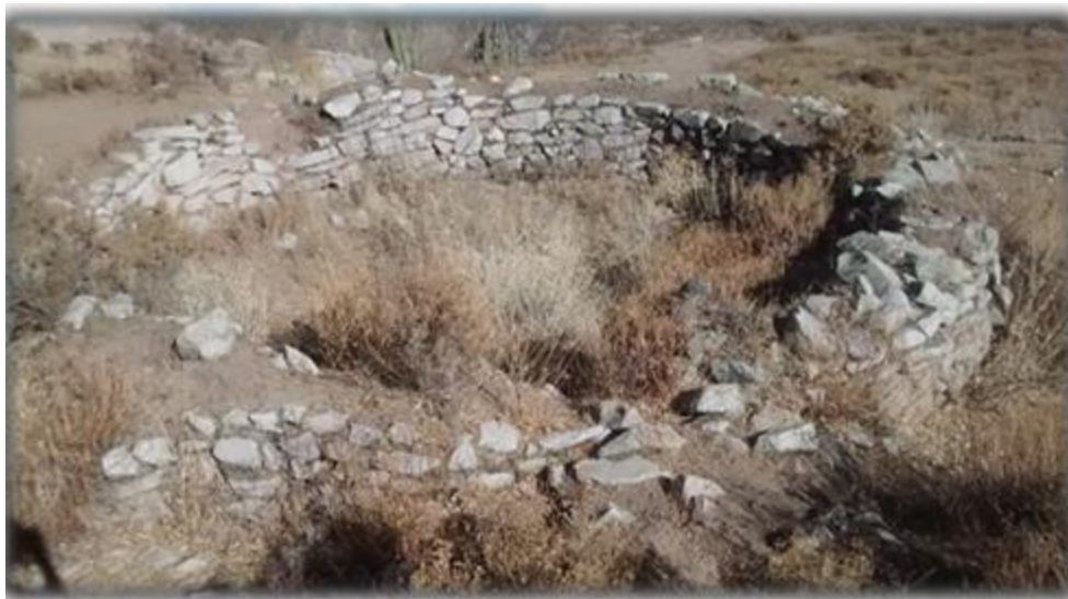
Reservorio Pre inca, en el sector de Huasta