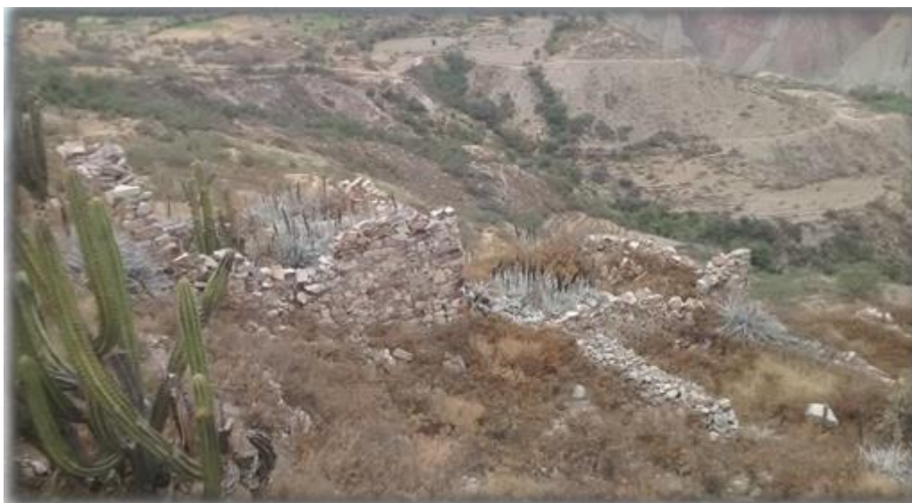
Ruinas Pre incas en Santa María