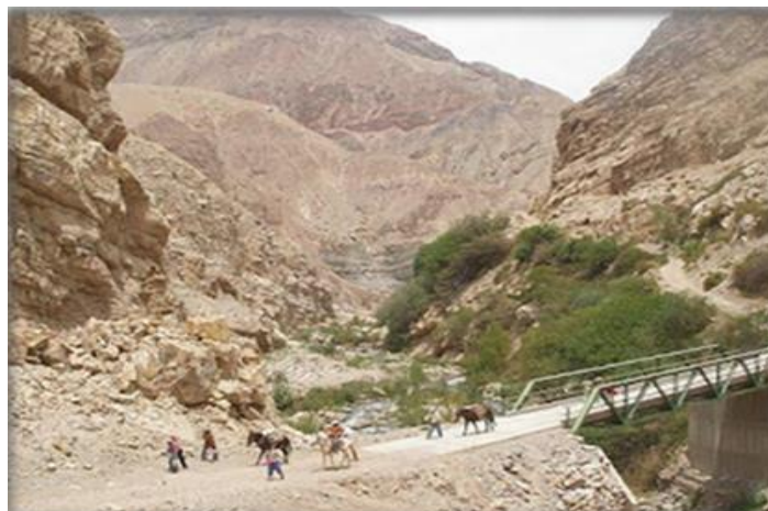
Puente Capiza, inicio de la caminata al Santuario de Uñon.