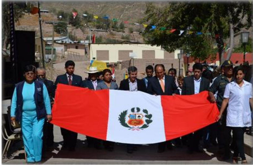
Paseo de la Bandera, Aniversario del distrito 2015