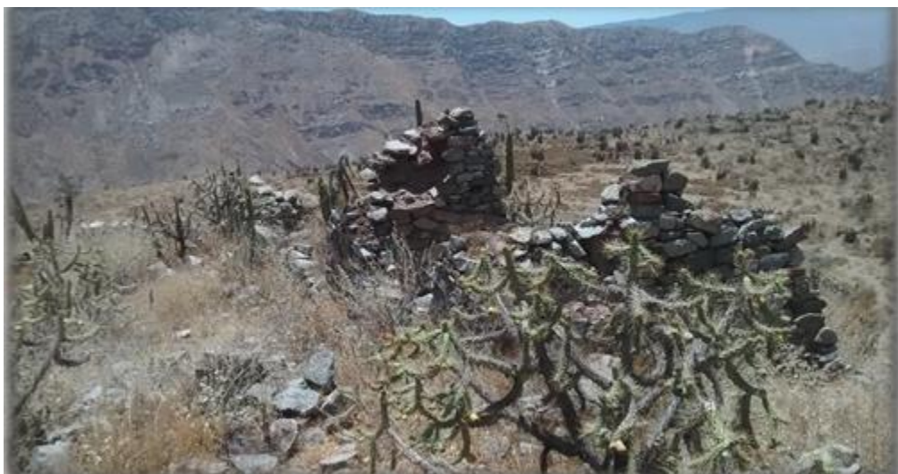
Ruinas pre incas, sector Machahuaycito

Fiestas Patronales: Uñon tiene uno santuarios más importantes de la provincia, donde se venera a la Santísima Virgen del Rosario patrona del distrito, la misma que es muy visitada y profundamente venerada por miles de fieles cada año durante su fiesta patronal.