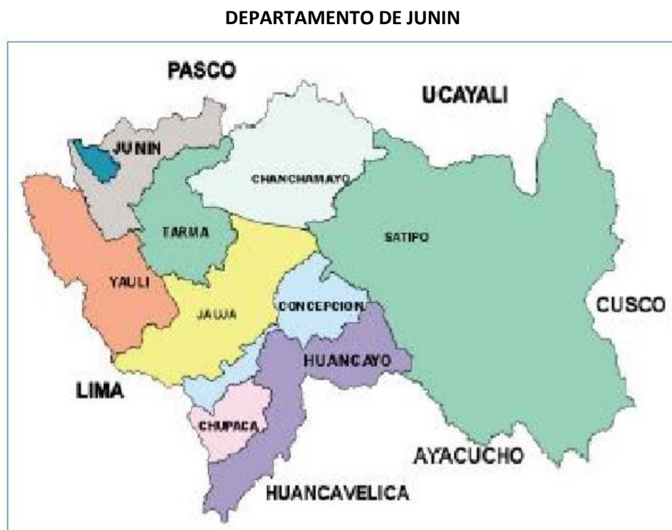
1.2 JUNÍN: EXTENSIÓN SUPERFICIAL, POBLACIÓN PROYECTADA, DENSIDAD POBLACIONAL Y ALTITUD, SEGÚN PROVINCIA, 2017

La Provincia de Concepción es una de las nueve provincias que conforman el Departamento de Junín, bajo la administración del Gobierno regional de Junín. Limita por el norte con la Provincia de Jauja; por el este con la Provincia de Satipo; por el sur con la provincia de Huancayo y; por el oeste con el Departamento de Lima.