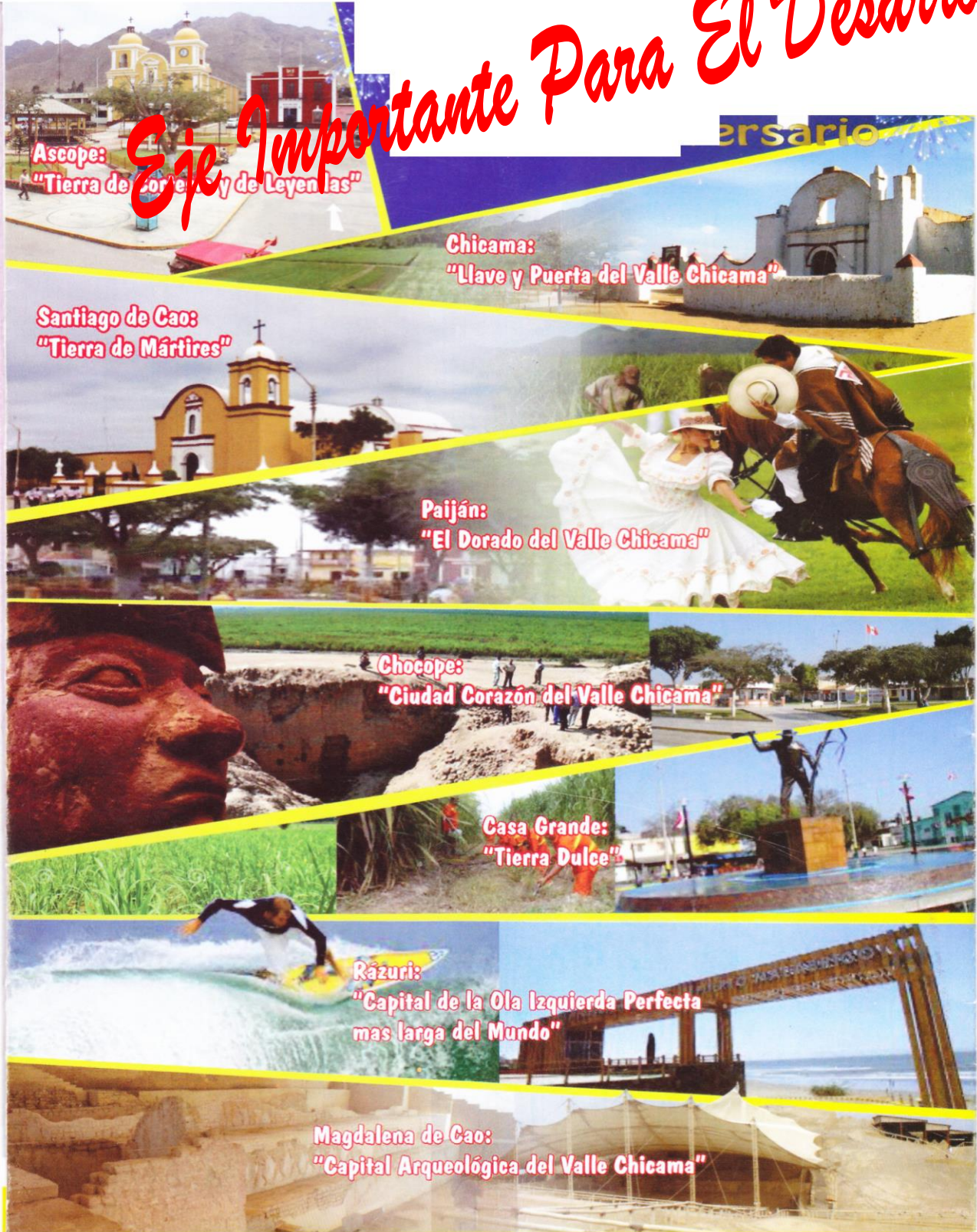
Ascope: "Tierra de Cortés y de Leyen las"