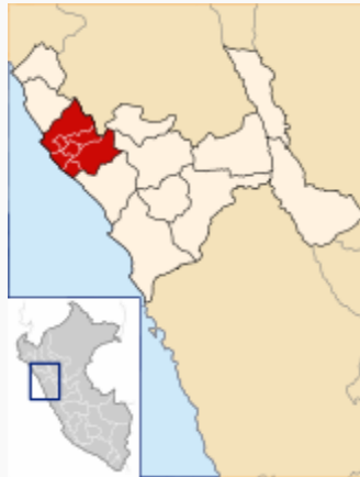
Ubicación de Provincia de Ascope