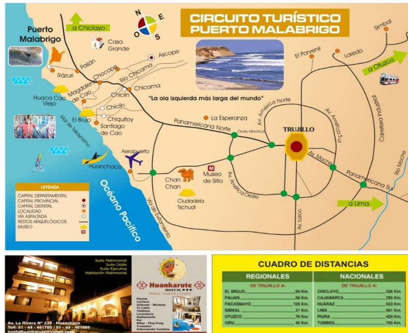
FIGURA 2 RECURSOS TURÍSTICOS DE LA PROVINCIA DE ASCOPE